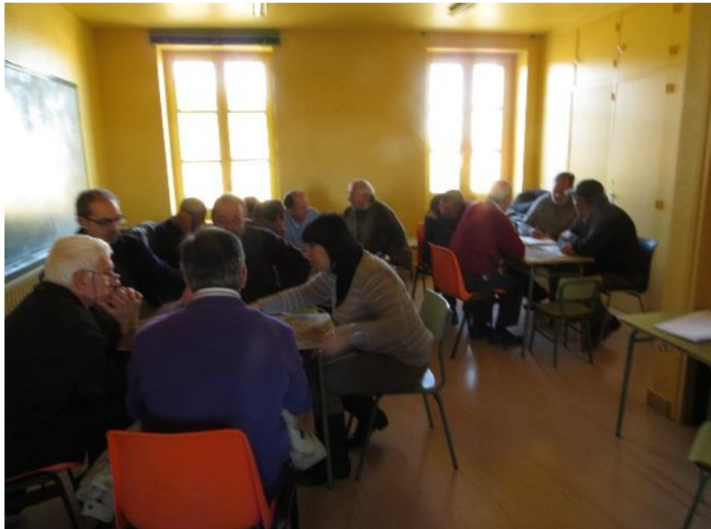
Taller de participación sobre territorio fluvial en Barasoain

Carnet de Identidad del río Cidacos, a cumplimentar por los participantes en los talleres de participación