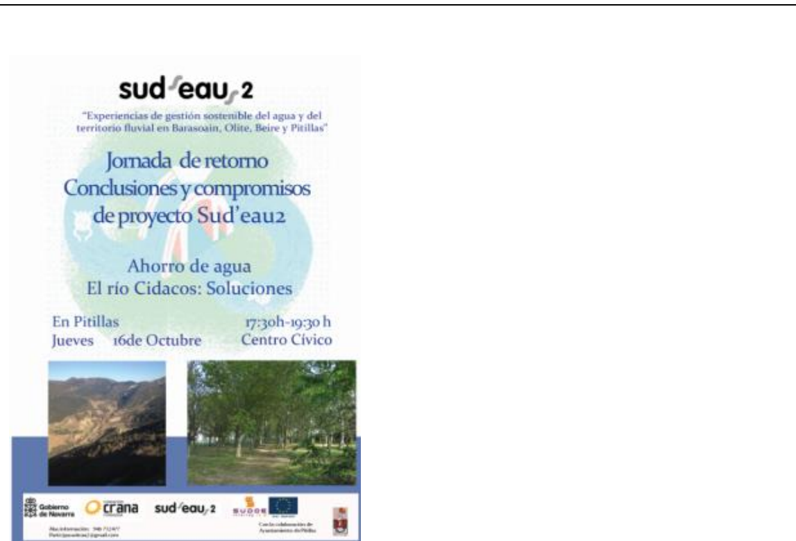
Cartel de una de las sesiones de retorno