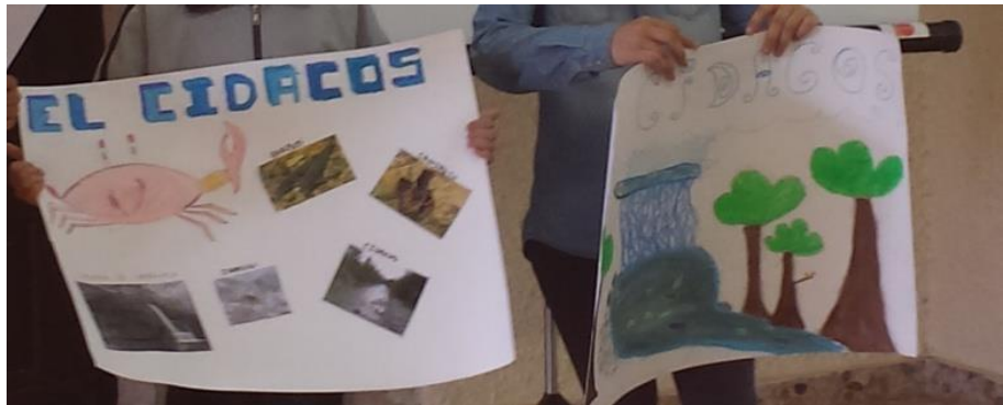
Trabajos de los alumnos de la escuela de Barasoain