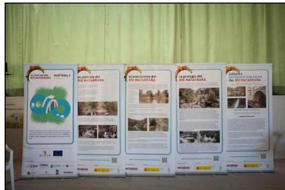
Exposición itinerante sobre el Contrato del río.