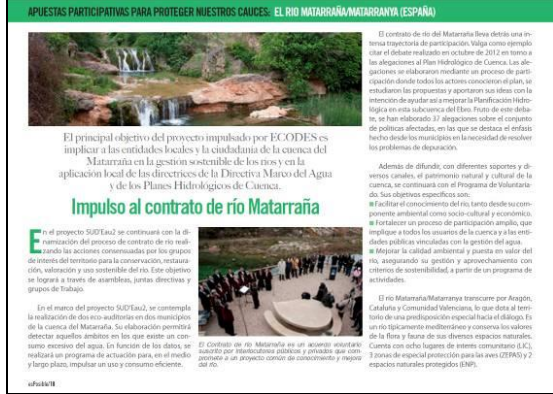
Página de la revista esPosible. Marzo 13