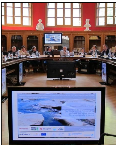
Intercambio de experiencias gestión participativa del agua Sudoeste UE-Brasil. Junio 2014.