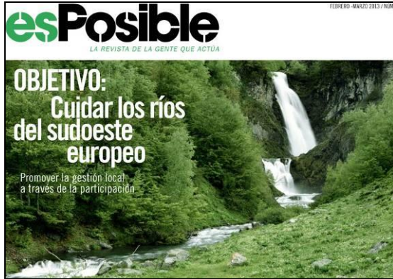
Portada de la revista esPosible. Marzo 13